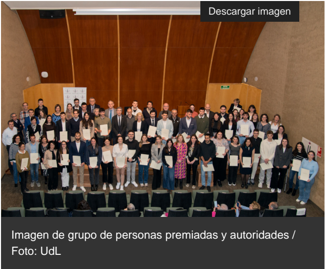
Imagen de grupo de personas premiadas y autoridades

La Universidad de Lérida (UdL) ha entregado este jueves los premios extraordinarios de grados y másteres [