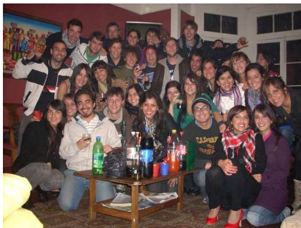
Integrants de la casa i uns amics que es van presentar per sorpresa

Les reunions d'amics eren quasi cada dia, s'organitzaven barbacoes al pati de la casa i ens reuníem amb gent d'altres universitats i altres intercanvis i gent del país per compartir i conèixer.