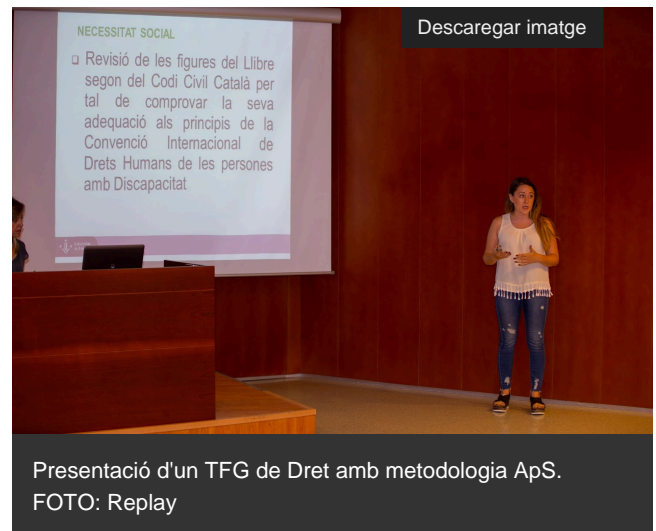
Presentació d'un TFG de Dret amb metodologia ApS.

L'Associació Catalana d'Universitats Públiques (ACUP) ha seleccionat com a projecte de bones pràctiques l' aplicació de la metodologia d'Aprenentatge i Servei (ApS) als treballs de final de grau de la Facultat de Dret, Economia i Turisme de la Universitat de Lleida [